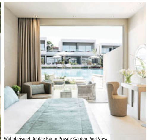
Wohnbeispiel Double Room Private Garden Pool View